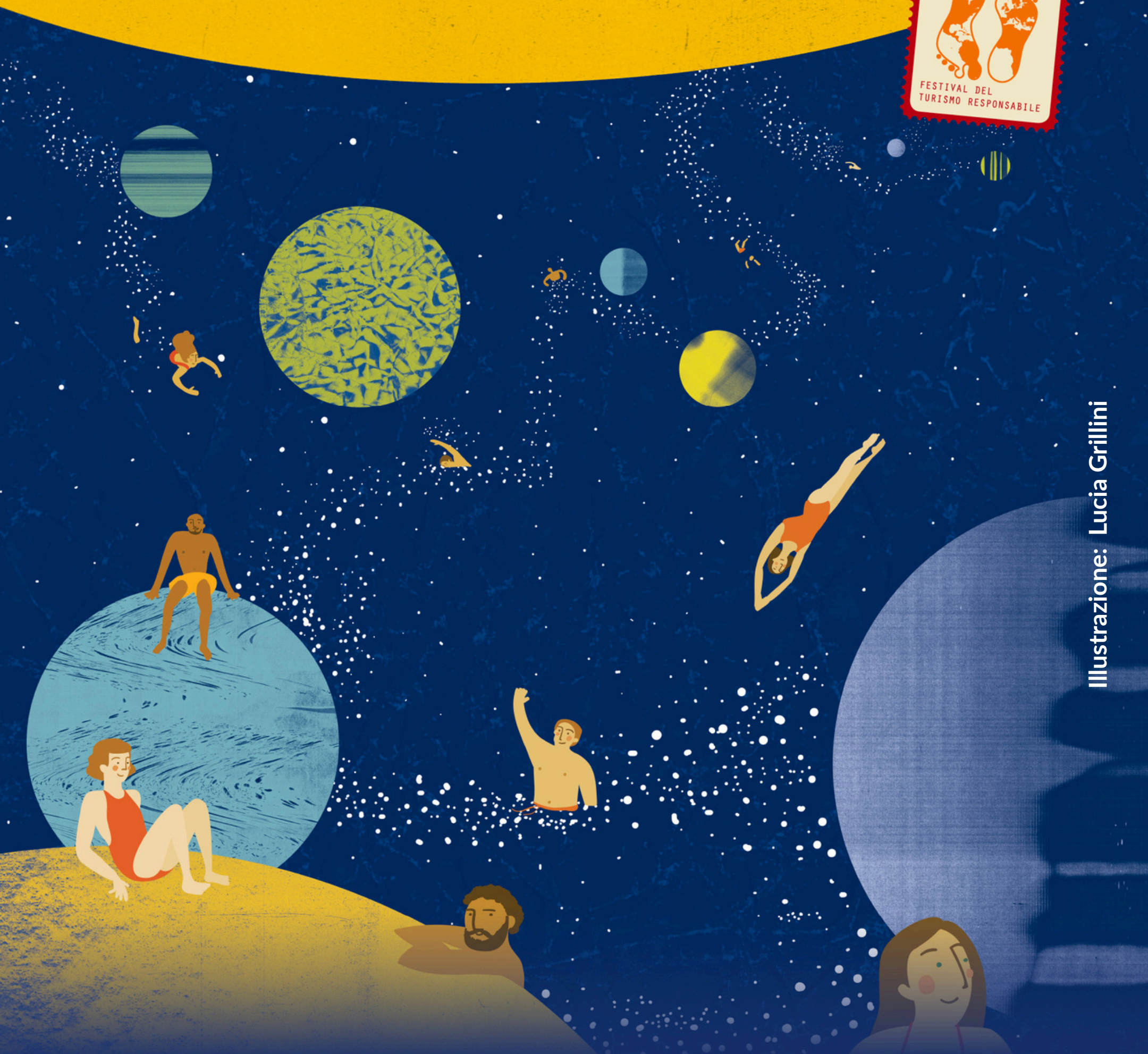
Illustrazione: Lucia Grillini